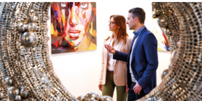
Die Galerie Villa del Arts auf der art KARLSRUHE 2017