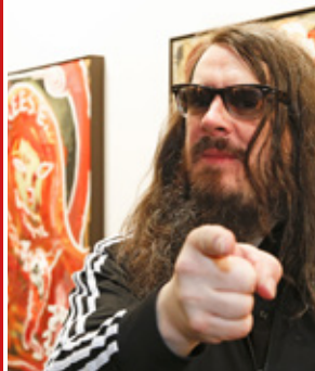
Jonathan Meese

24.02.2018, 11:30 Uhr art KARLSRUHE-Preis