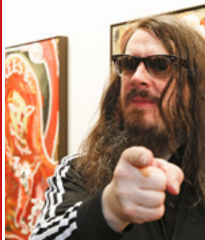
Jonathan Meese

24.02.2018, 11:30 Uhr art KARLSRUHE-Preis